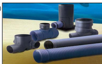
下水道用パイプ 下水道用マンホール継手