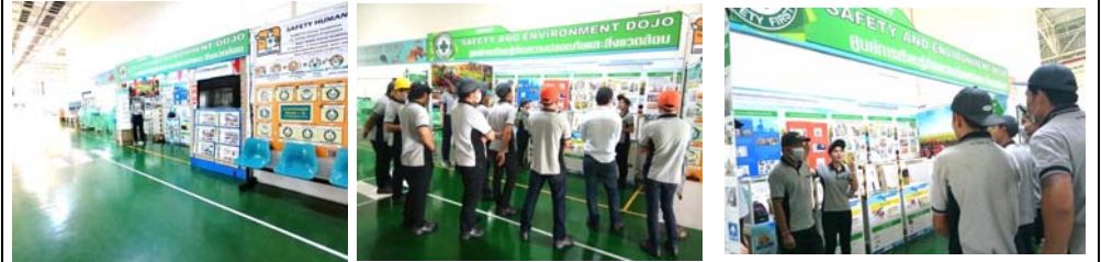
# Environment Dojo setting for training new employee and re-training