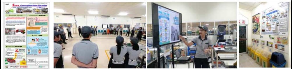
# Environment weekly new information to all KPMT member, 1 time / week