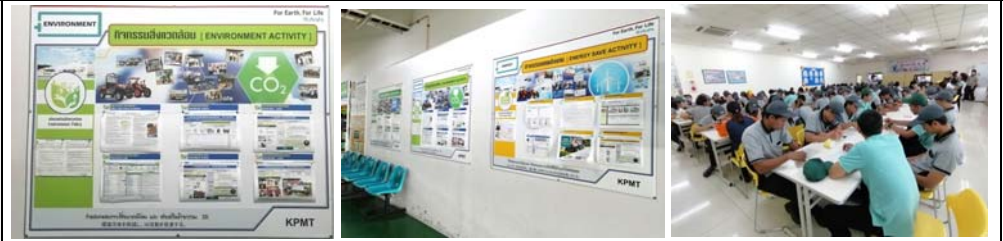
# Environment information data all KPMT member, 1 time / month