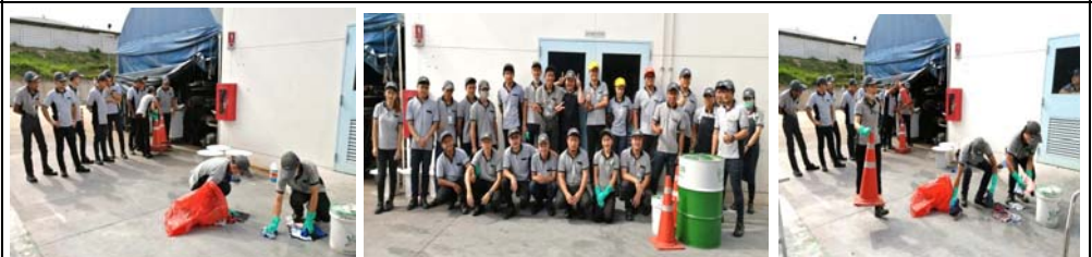
# Chemical emergency leak respond practice for environment pollution protect