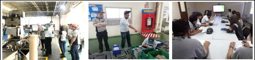
# Environment patrol all KPMT area, 1 time / month