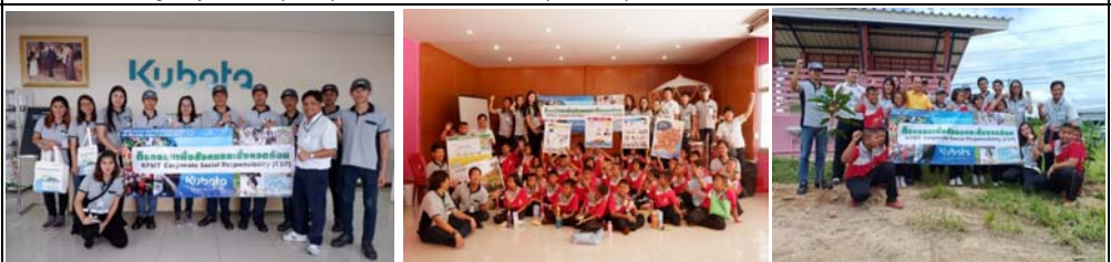
# Environment CSR and Tree planting for Social Responsibility [Community near KPMT (In area 5 Km. )]