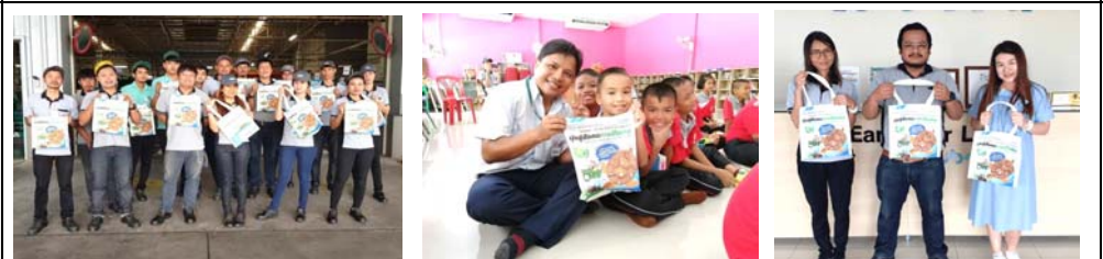
# ECO bag for 3R activity