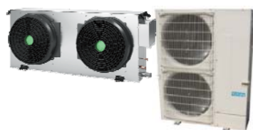
工場向けエリア空調機