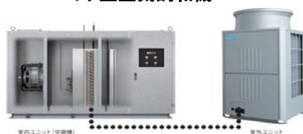
ヒートポンプ空調機