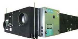
調湿外気処理ユニット