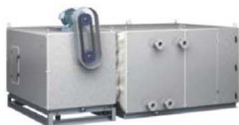
ユニット型空気調和機