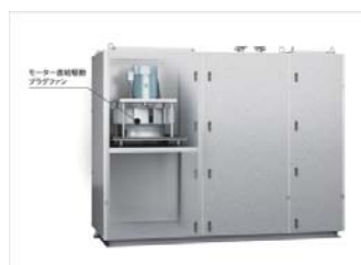
コンパクト型空気調和機