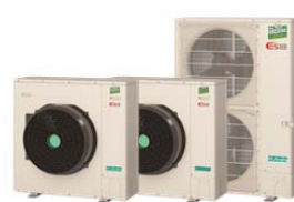
農業用HP空調機(ぐっぴーバズーカ)