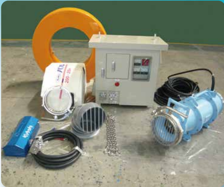
注) 動力用発動発電機(45kVA)は含まれておりませんので別途リースでご用意願います。

1台で5m 3 /min(全揚程10mにおいて)の排水能力を有しながら、全て人力で設営可能なユニットです。 局地的豪雨等による浸水被害時にも迅速な排水活動が可能になります。