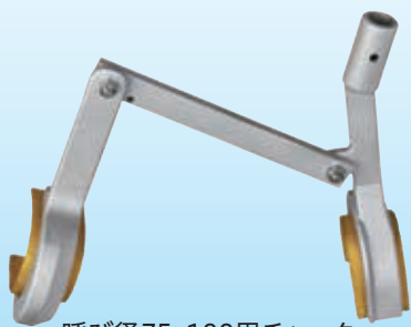
呼び径75・100用チャック