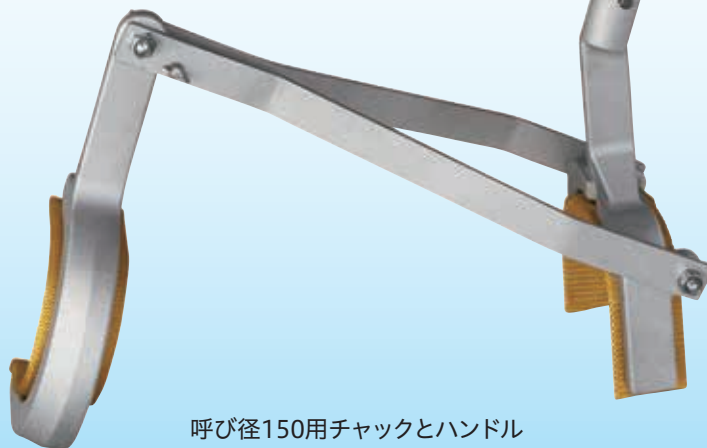
呼び径150用チャックとハンドル