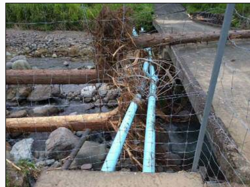
< 水管橋 (FT形/SⅡ形) 呼び径150mm×2条に流木が激突している様子 >

兵庫県養父市では、今年8月に発生した台風7号による河川増水で、流木が水管橋 (FT形/SⅡ形) 呼び径150mm×2条に激突しました。管体に変形したにも関わらず、断水することなくライフラインを維持することができ、ダクトイルcast鉄管の継手性能および強靱性に対し養父市まち整備部上下水道課様から再評価をいただきました。