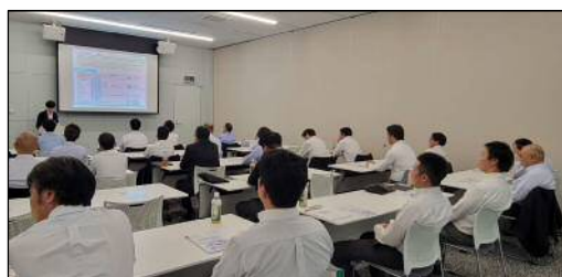
< 説明会の様子 >

今後は渡辺パイプ株式会社様の御協力のもと、工事事業者様へのPRを強力に展開していきたいと考えております。