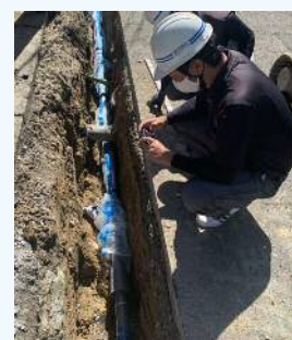
〈 施工現場の様子 〉

弊社は、水道工事現場における生産性の向上を目指し、従来より市販の工事管理用ソフト等を積極的に導入しています。