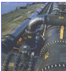
異形管を用いた配管風景