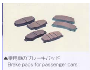
▲乗用車のブレーキパッド Brake pads for passenger cars