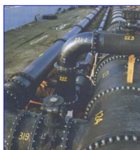
異形管を用いた配管風景