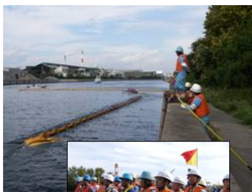
運河に油が流出した場合を想定して総合防災訓練の実施 (2012.10.10 14:00～)