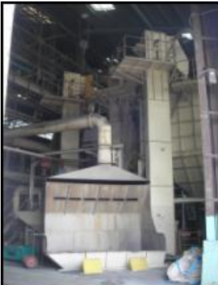
尼崎(異形管砂再生)