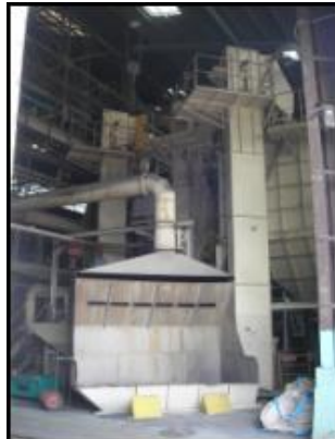
尼崎(異形管砂再生)