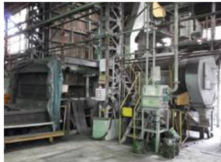
尼崎(ロール砂再生)