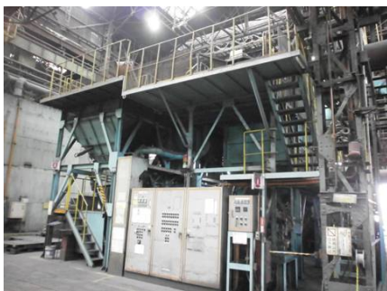
武庫川(鑄物砂再生)