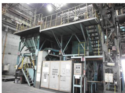
武庫川(鑄物砂再生)