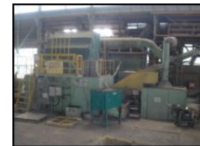
尼崎(ロール砂再生)