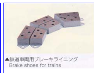
▲鉄道車両用ブレーキライニング Brake shoes for trains