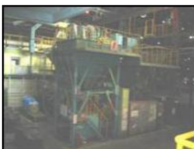
武庫川(鑄物砂再生)