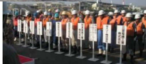
②運河に油が流出した場合を想定して総合防災訓練の実施 (2009.10.30 14:00～)