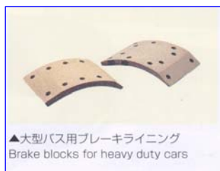
▲大型バス用ブレーキライニング Brake blocks for heavy duty cars