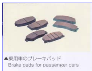
▲乗用車のブレーキパッド Brake pads for passenger cars