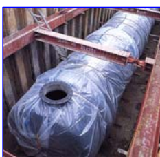
耐震・緊急用貯水槽