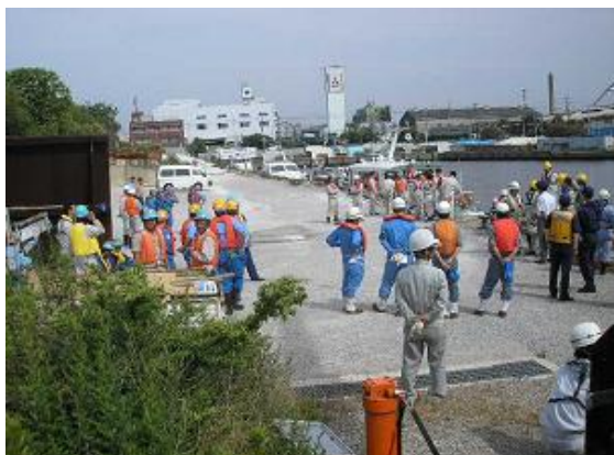
①大阪湾クリーン作戦への参加 (2009.6.23 14:00～)