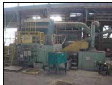
尼崎(ロール砂再生2基)