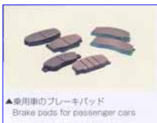
▲乗用車のブレーキパッド Brake pads for passenger cars