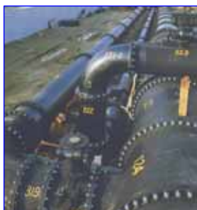
异形管を用いた 配管風景

▶ 概要 尼崎事業所は大正6年(1917年)に、鑄鉄管、鋼塊用鑄型の製造を端緒に操業を開始しました。近代鑄物の黎明期から、数々の独創的技術を開発し、各分野に鑄物製品を送り出してきました。 この伝統を受け継ぎ、現在も産業界から厚い信頼を得ている圧延用ロール、鑄鉄異形管の主力工場として生産しています。 そして近年は、科学技術庁の研究成果をもとに、機能性セラミックス素材であるチタン酸カリウムの開発・製造も担っています。