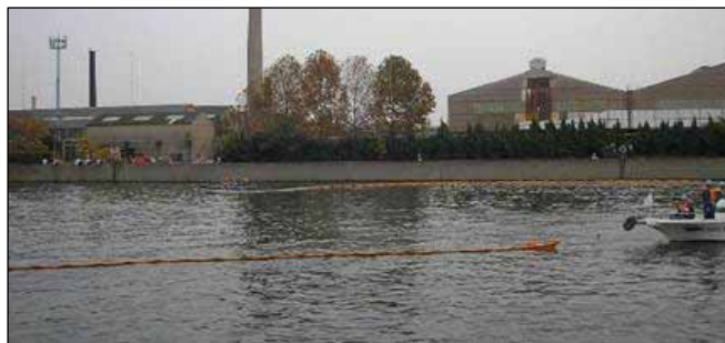
運河に油が流出した場合を想定して総合防災訓練の実施 (2007.6.20 14:00～)