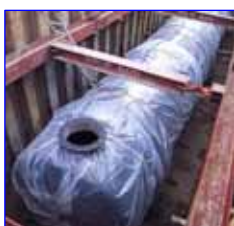
耐震・緊急用貯水槽