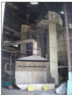
尼崎(異形管砂再生)