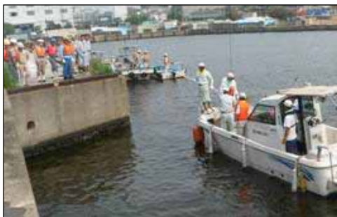
大阪湾クリーン作戦への参加 (2007.11.22 14:00～)