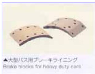
▲大型バス用ブレーキライニング Brake blocks for heavy duty cars