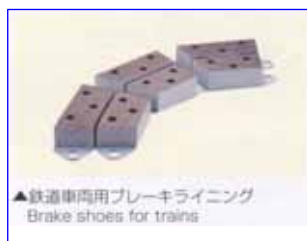
▲鉄道車両用ブレーキライニング Brake shoes for trains