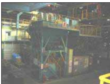
武庫川(鋳物砂再生)