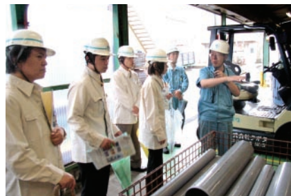
クボタシーアイ堺工場