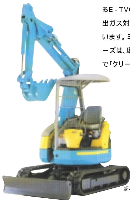
超小旋回ミニバックホー RX-303

数がアイドリング状態になり、操作を再開すると中断前のエンジン回転数に戻るオートアイドル機能付きの製品もあり、都市工事や夜間工事のように騒音の気になる工事でも安心して作業ができます。また環境汚染の原因となるHC(炭化水素)、CO(一酸化炭素)、NOx(窒素化合物)などの化合物の排出を最小限に押さえるE-TVCSエンジンを搭載し、建設省排出ガス対策型建設機械の指定を受けています。ミニバックホ - 「KINGLEV」シリーズは、環境と人を第一に考えた「静か」で「クリーン」な製品です。