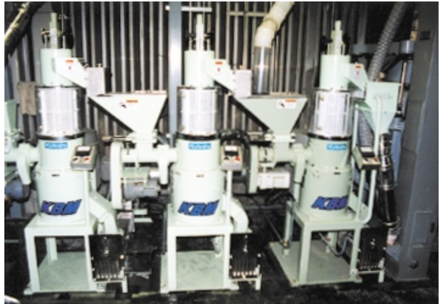
ニュー「リ・フレ」システム KBM-3P-45

を入れ軽くかき混ぜるだけで炊けるので、加工・炊飯工程を通じ、水質汚濁物質の発生はありません。お米の表面に残っている脂質やリンを取り除いているので貯蔵性、外観品質も向上します。