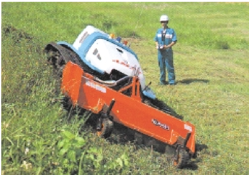
ラジコン芝刈り機 (AMX-7)