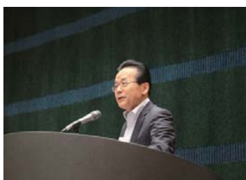
CSRフォーラム (経営幹部向け講演会)

当社では、CSR、人権、安全、環境、品質等のテーマに関して役員フォーラムを開催し、経営の監督に必要な知識の取得・更新の機会を付与しています。2016年1月～12月は延べ140人の役員が出席しました。また、当社の事業活動についての理解を深め適切な経営判断が行えるよう、海外関連会社・国内事業所での取締役会開催、視察、現場幹部とのディスカッション(それぞれ年1回以上)を実施しています。