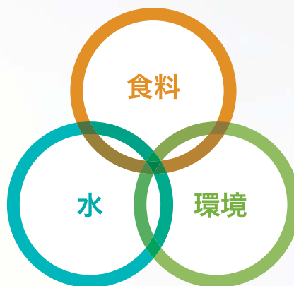
クボタ・グローバル・ループ

人類の生存に欠かすことのできない食料・水・環境。 クボタグループは、優れた製品・技術・サービスを通じ、 豊かで安定的な食料の生産、安心な水の供給と再生、 快適な生活環境の創造に貢献し、地球と人の未来を支え続けます。