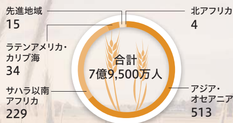
地域別栄養不足人口 (単位:100万人)