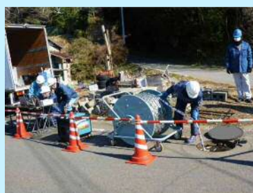
〈CSカメラ スネークくんでの調査〉