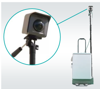
ポータブル機材(バッテリー、ルータ込み)