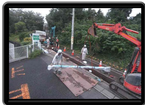
タブレット等で施工現場の状況を確認可能