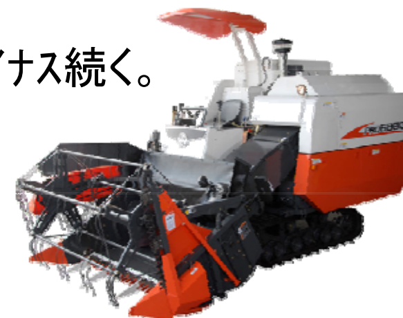
普通型コンバインPRO688Q(中国仕様)