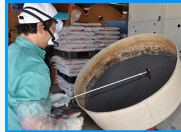
種もみの鉄コーティング作業の様子 低コスト農法として作付面積も拡大