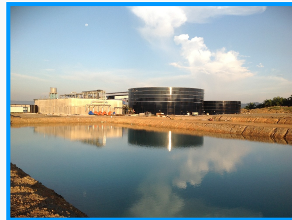
建設中のマレーシア・パーム搾油施設向け バイオガス・廃水処理設備