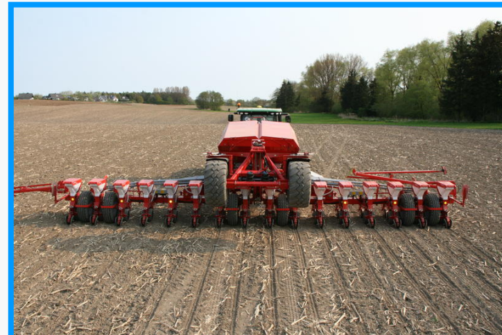
作業幅12mのトウモロコシ播種用インプラメント(クバンランド製)