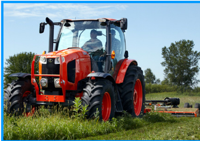
当社最大馬力トラクタ(135馬力) 米国向け