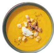
人参ポタージュ ハーフサイズ