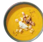
人参ポタージュ ハーフサイズ